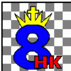
DANSK SKAK UNIONS 8. HOVEDKREDS